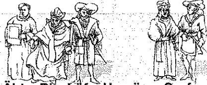
Äbte, Bischöfe, Herzöge, Grafen